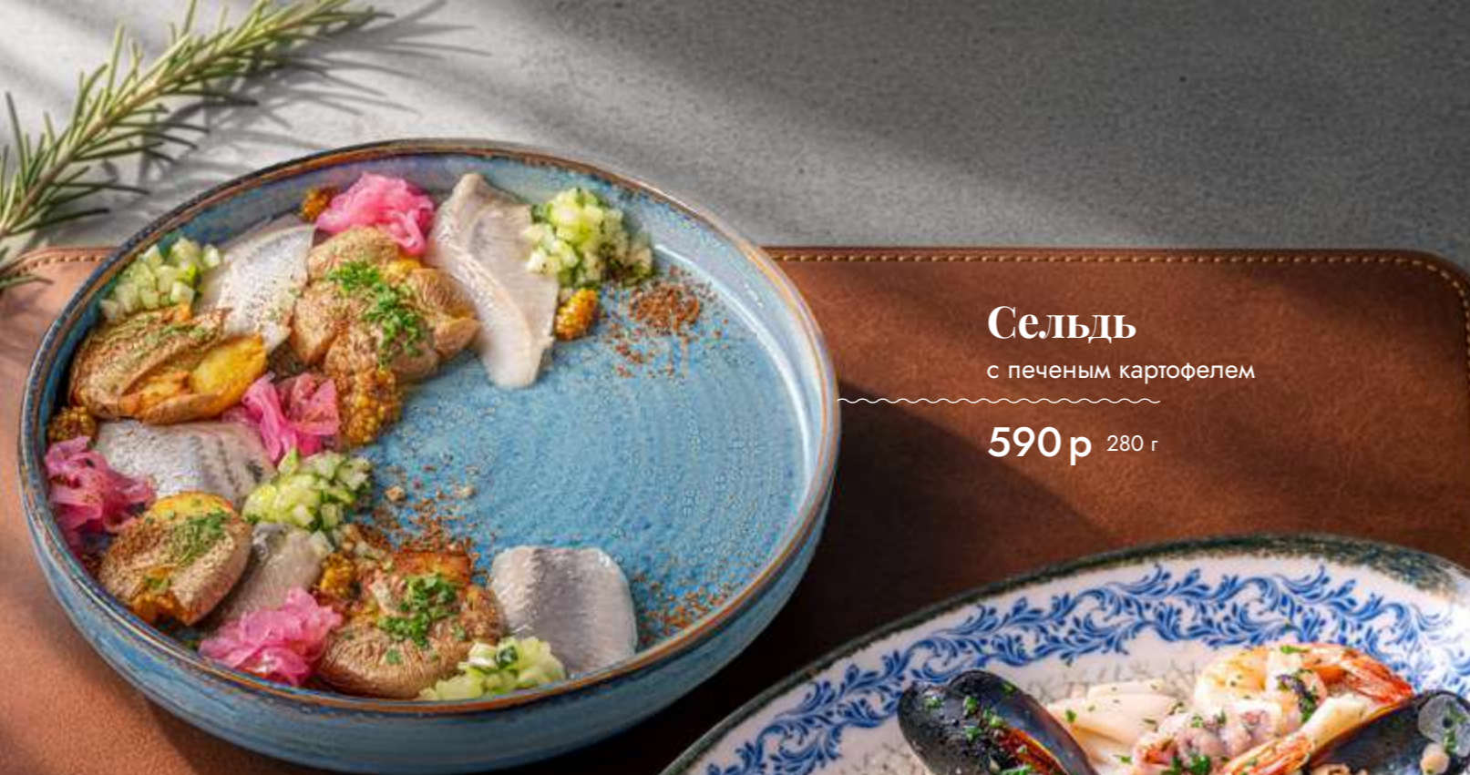
Сельдь с печеным картофелем 590 р 280 г