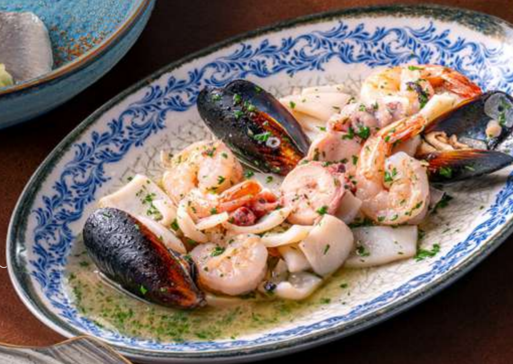
Жаркое из морепродуктов с овощами 1340 р 360 г