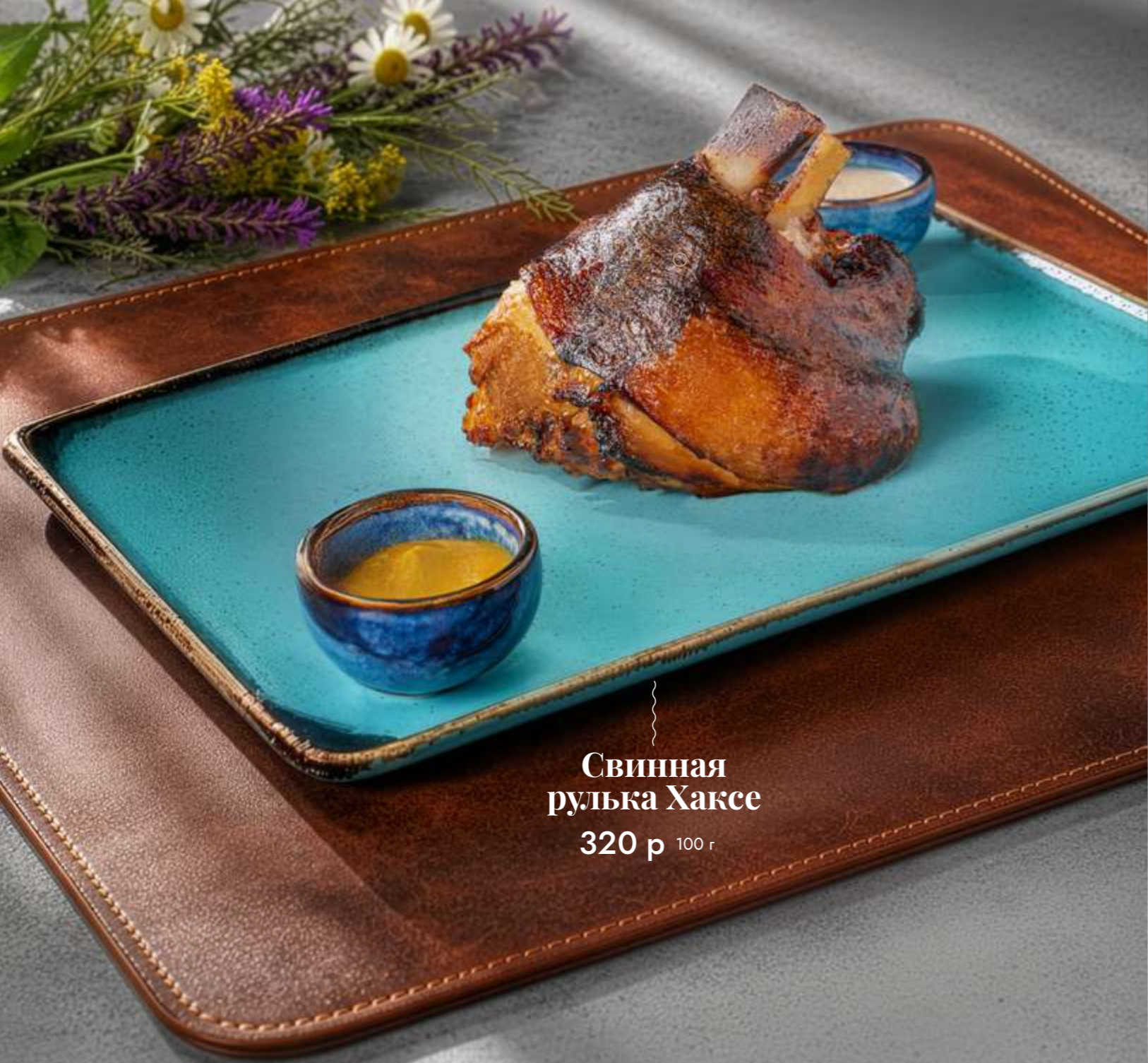
Свинная рулька Хаксе 320 р 100 г